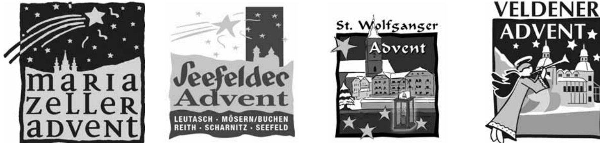
Az Advent Ausztria együttműködésben részt vevő városok logói

Az Advent Ausztria marketingszervezet közös logóját a kommunikációban kiegészíti a négy település önálló adventi jelképe, amelyek egyszerre tükrözik a városok önálló imázsát és hasonló vizuális elemeket alkalmazva alkotnak harmonikus egységet (3. ábra).