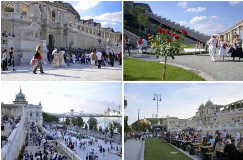
開業した王宮バザール