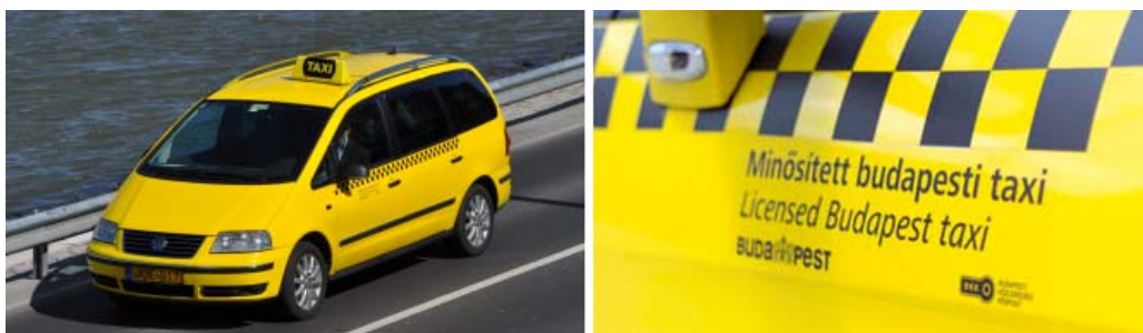
ブダペストのタクシーと営業許可ステッカー