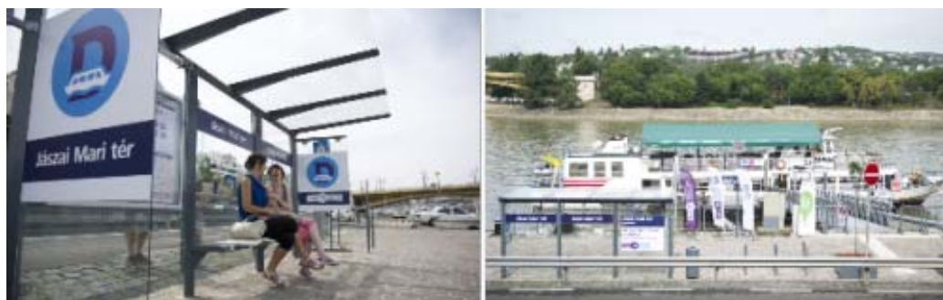
ヤーサイ マリ広場 (Jászai Mari tér) 乗船所 (ブダペスト交通局のサイトから転載)

観光で訪れる方へお勧めの区間は、ヤーサイ マリ広場 (Jászai Mari tér) から聖ゲレルト広場 (Szent Gellért tér) まで、またはボラーロシュ広場 (Boráros tér) までです。