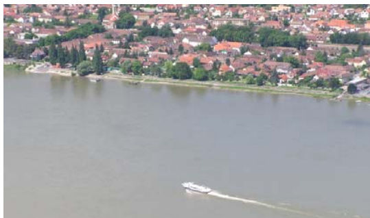
ドナウベンドを航行する水中翼船