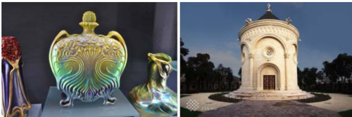
左：ジョルナイの黄金時代作品 右：ジョルナイ家の墓所