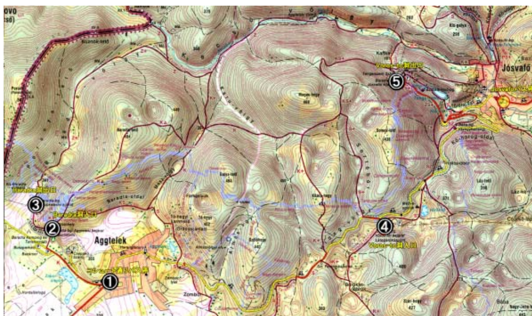
アッグテレク周辺の地形図 (Cartographia 社地形図から作成)

なお、Vörös-tó 洞入口(④)付近にはブダペストからのバスは停車しないので、アッグテレクバス停から約 3km を歩く必要がある。ただし、ミシユコルツ方面からの鉄道駅である Jósvalfő - Aggtelek 駅と Aggtelek, Bradra 洞間のバスは停車(Vörös-tó, Barlang bej.árat út 停留所)する。