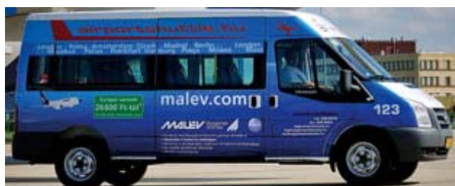
シャトルバスのイメージ