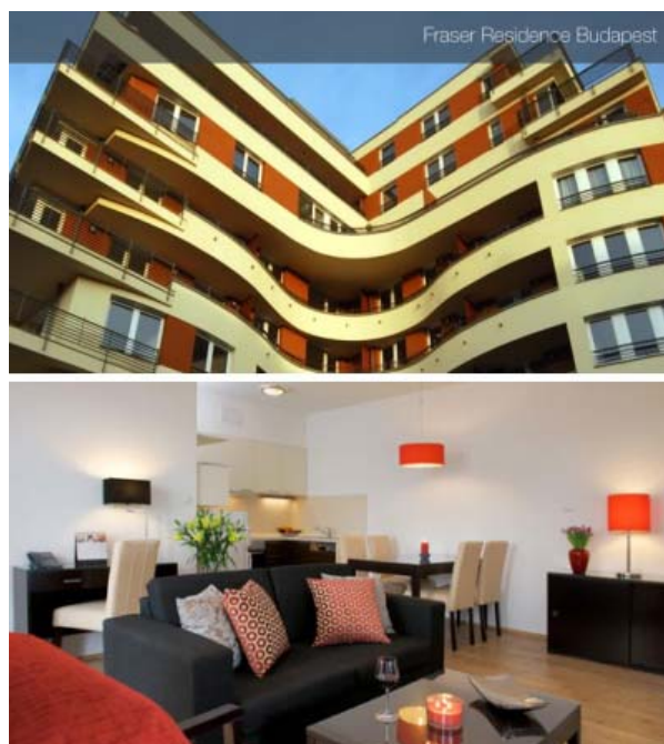
フレイザー・レジデンス・ブダペストのイメージ(同社の HP より)

http://budapest.frasershospitality.com/ (英語)