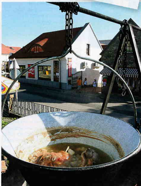
GULASJ: Tradisjonen tro koker ungarerne supper og gulasjretter ute over åpen ild i store spann med hank. Her kan det putte i timevis.