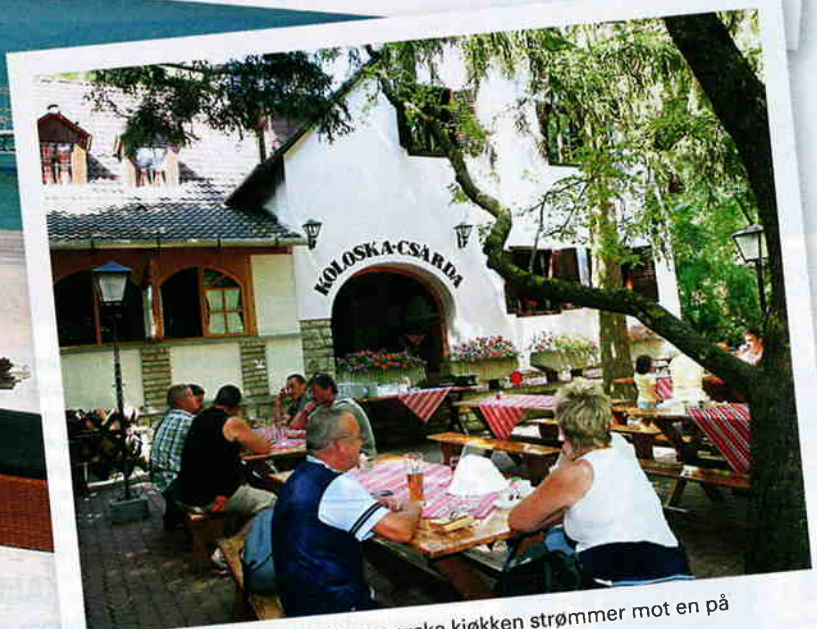
VERTSHUS: Duften av det ungarske kjøkken strømmer mot en på en ungarsk csárda – et tradisjonelt vertshus.