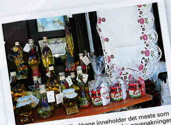
GODT PÅ GLASS: Krukkene inneholder det meste som syltes kan. Paprikapulver selges i alt fra gavepakninger til kilospakker ved siden av håndbroderte duker.