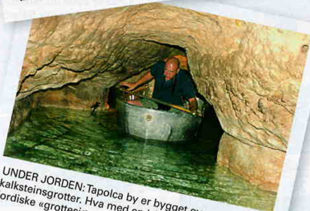
UNDER JORDEN: Tapolca by er bygget over utallige kalksteinsgrotter. Hva med en båttur på den underjordiske «grottesjøen»?