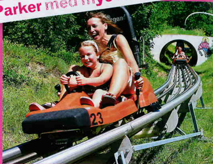
FULL FART: Mor og datter hyler av fryd ned den 800 meter lange bobbannen i Sherpa- og eventyrparken i Balatonfuzfo.

✓ I Balatonfuzfo finnes det en spennende opplevelsespark. Der kan man blant mye annet kose seg i klatrevegger, balansere via svingende hengebroer over tretoppene, skli pr. wire gjennom skogbrynet eller kjøre slede ned en 800 meter lang bobbane i «fritt fall».